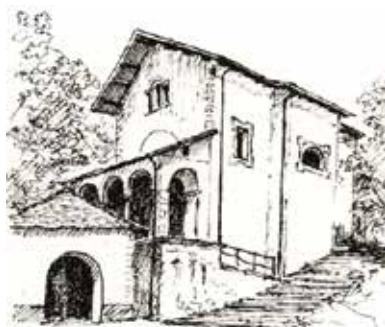
Santuario Madonna della Fontana (Ascona)