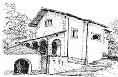
Santuario Madonna della Fontana (Ascona)